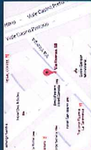
Best Western Hotel Canada Via Vicenza 58 - 00185 - Roma