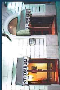
Hotel Stromboli Via Marsala, 34 I - 00185 Roma